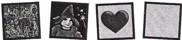
Torner Den onde feen Hjerte Blank brikke