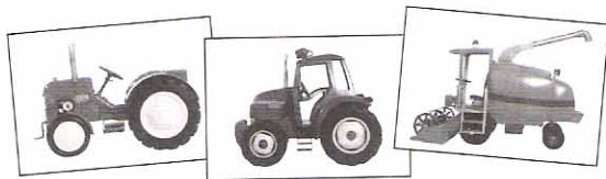
Den Lille Røde Traktoren, Blå Boss og Treske

Spillet fortsetter med spilleren til venstre.