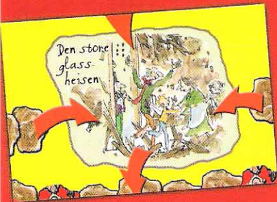
Den store glassheisen