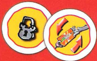
Hengelåsbrikke og kortbrikke